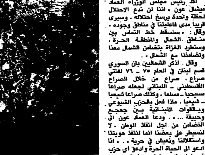
العماد عون يخطب في الجماهير والى جنبه ابي الميمون